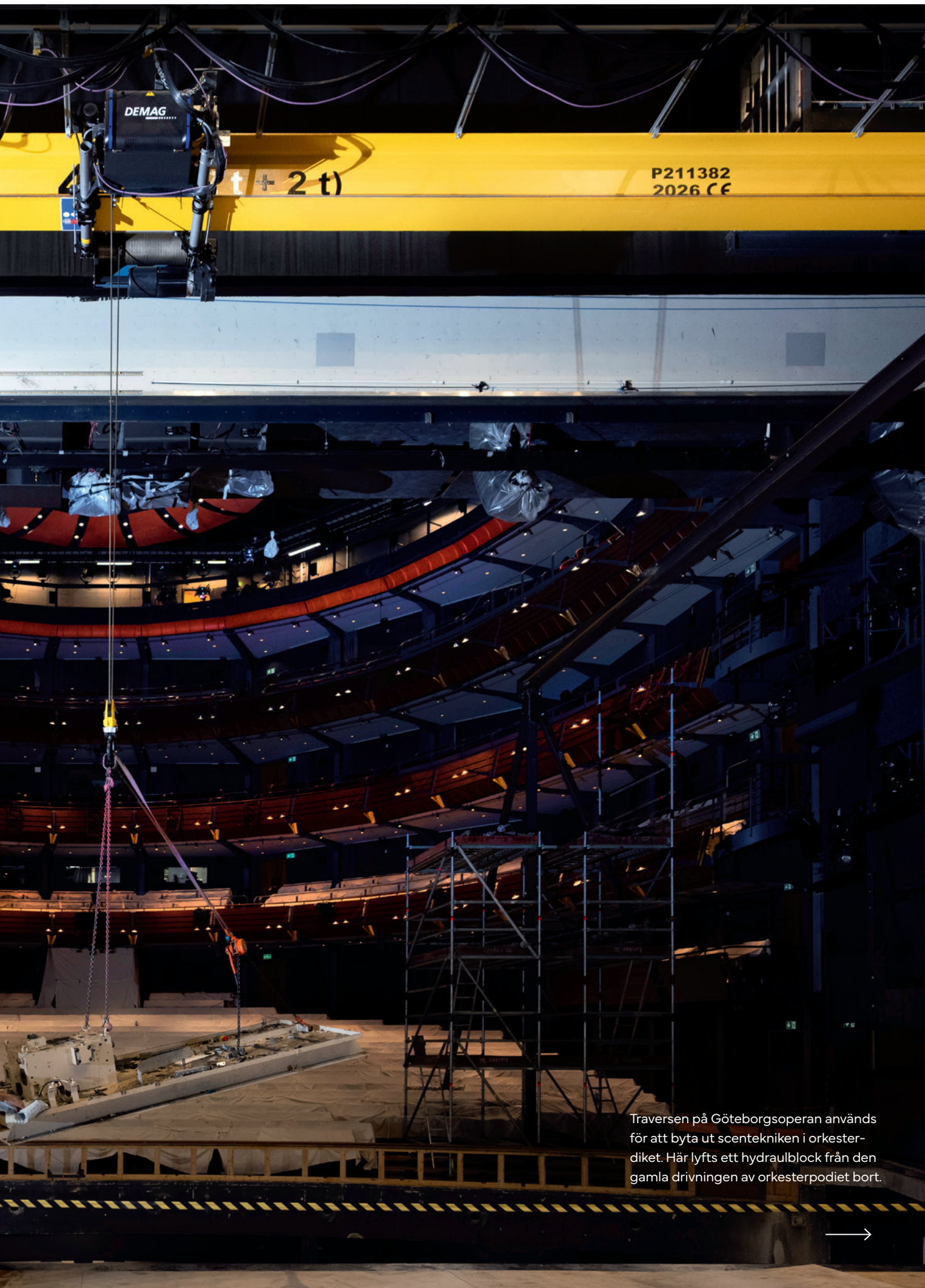
Traversen på Göteborgsoperan används för att byta ut scentekniken i orkesterdikedet. Här lyfts ett hydraulblock från den gamla drivningen av orkesterpodiet bort.