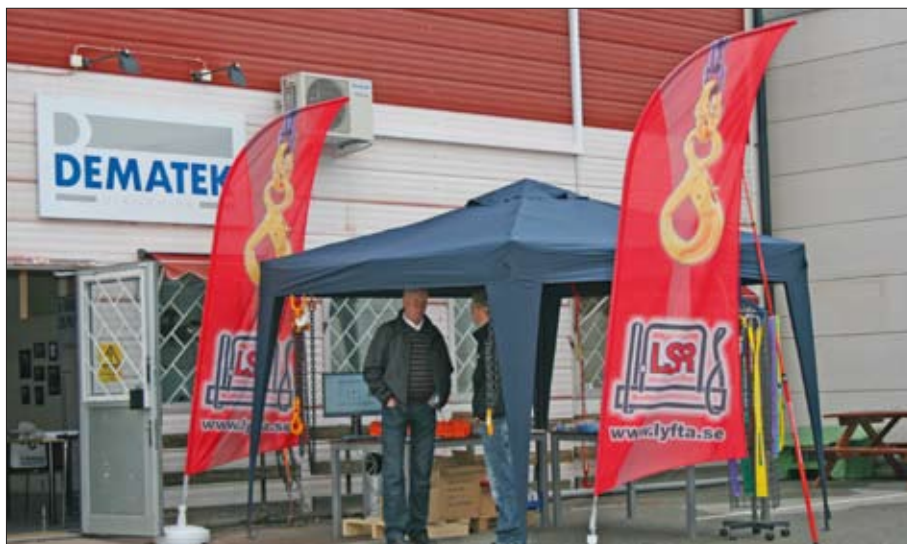
Det syntes att Lyft & Surrningsredskap fanns på plats.