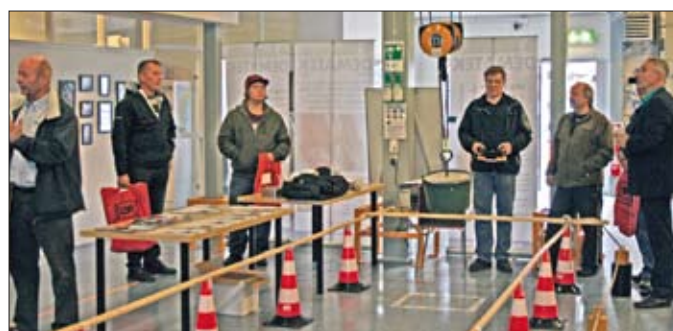
Det gäller att ha tungan rätt i mun när man skall köra lyft! Ett uppskattat inslag på minimässan var tävlingen som gick ut på att man skulle köra travers på ett säkert sätt.