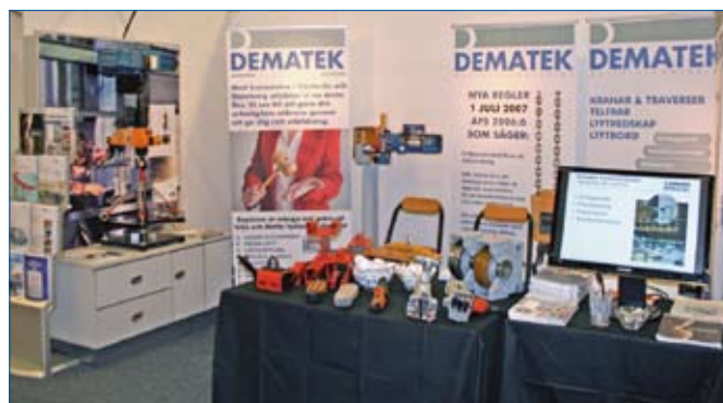
Demateks monter var välbesökt (förutom när den här bilden togs).