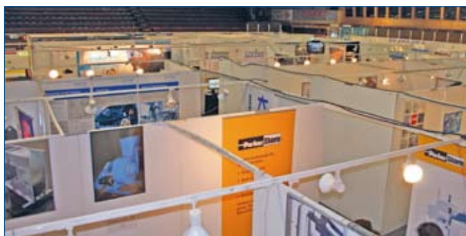
Labyrinten på EuroExpo innehåller många utställande företag.