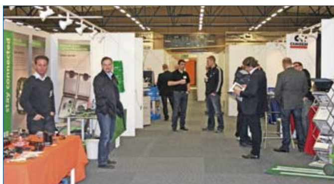
Närmare 100 utställare fanns med på EuroExpo i Värnamo och Eskilstuna.