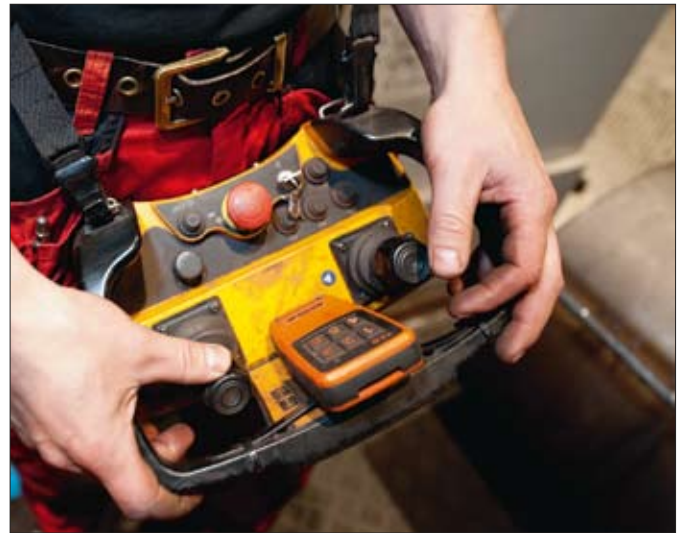
En person sköter hela logistiken, med radiostyrning.