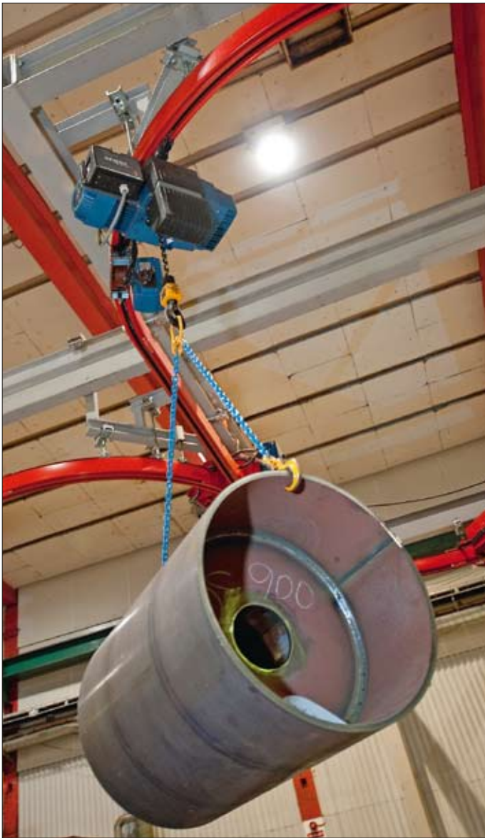
En ny vals under produktion.