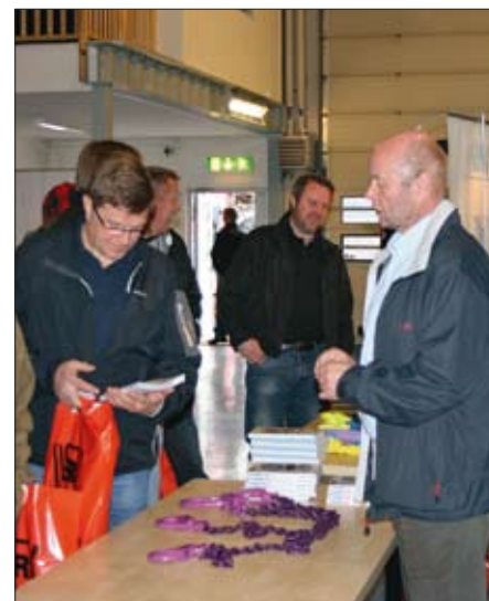
Minimässan gav flera nya förfrågningar att följa upp.