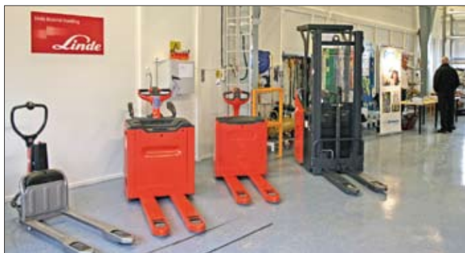
Att Linde har ett brett program av truckar framgick tydligt på mässan.