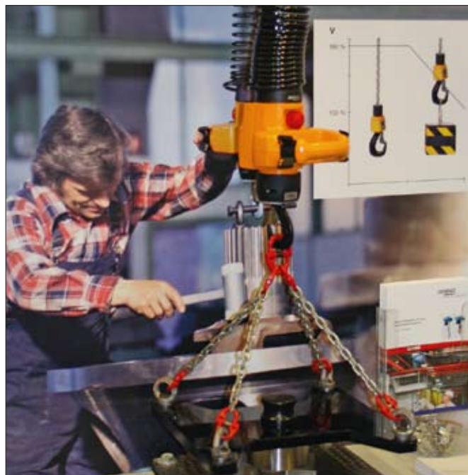
I montern fanns Demateks steglösa manulift, som t.ex. är bra när man skall byta ett verktyg i någon maskin.

”I Demateks monter kunde mässbesökarna bland annat ta del av information kring säkerhetsutbildningar samt provköra den nya telfern DCMS, med steglös hastighetsreglering”