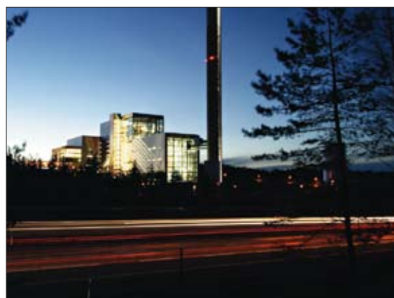
Kraftvärmeverket Torsvik är en imponerande anläggning.

Varje dag, år ut och år in är kraftvärmeverket Torsvik igång med att omvandla avfall till värme och el. Två helautomatiserade Demag-kranar blandar avfallet och matar in det som bränsle i ångpannan. Miljön är tuffast tänkbara och det krävs därför regelbunden service av anläggningen. Demateks servicetekniker är på plats minst en gång i månaden för underhåll och förebyggande service.